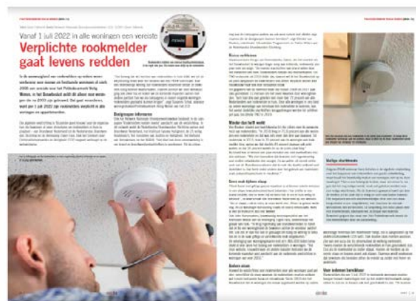
Raam en Deur